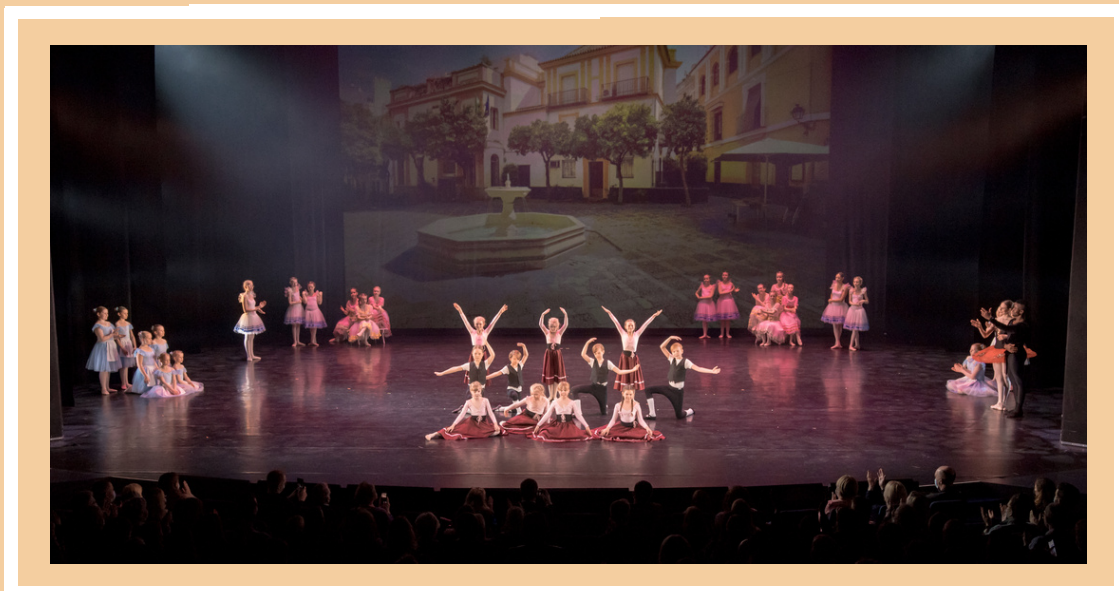
Mynd frá vorsýningu Dansgarðsins 2021