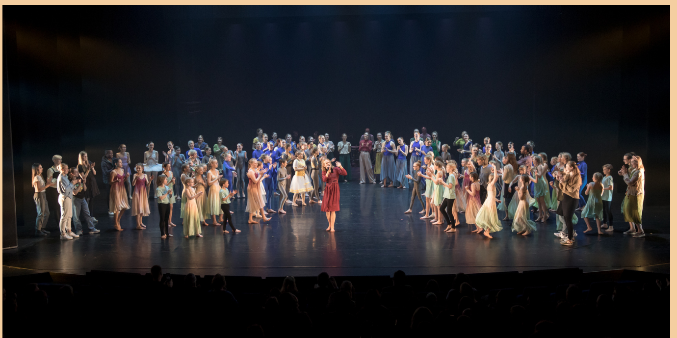
Mynd frá vorsýningu Dansgarðsins 2021

Við erum að safna jólafötum fyrir uppsetninguna á Hnotubrjótnum svo ef þið eruð með einhver spariföt í geymslunni sem þið eruð til í að gefa eða lána þá þætti okkur mjög vænt um það. Við tökum á móti fötum á Grensásvegi, Eiðistorgi og Álfabakka.